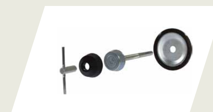
BULÓN DE SEGURIDAD PARA RUEDA DE AUXILIO