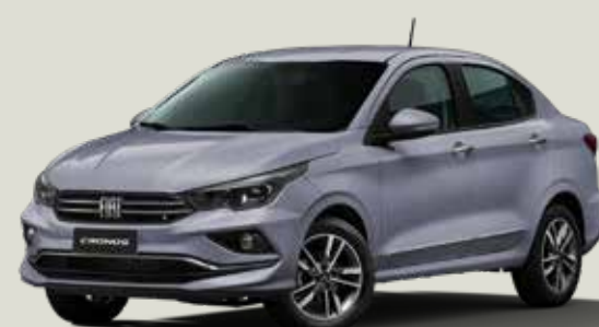
540 - Gris Strato