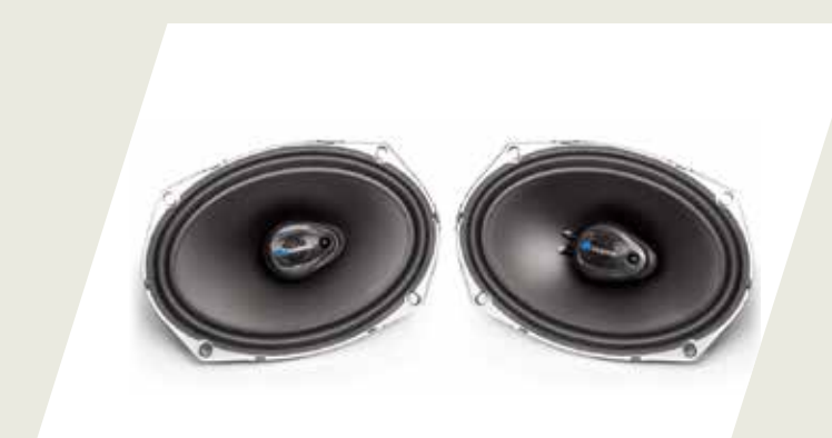
KIT PARLANTES TRASEROS