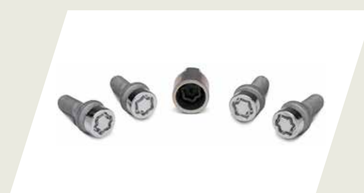
JUEGO DE TORNILLOS ANTIROBOS PARA RUEDA