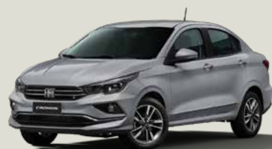
619 - Plata Bari