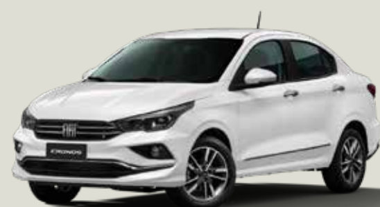
249 - Blanco Banchisa