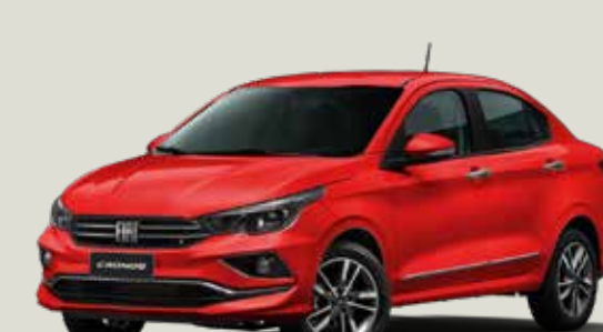
978 - Rojo Montecarlo