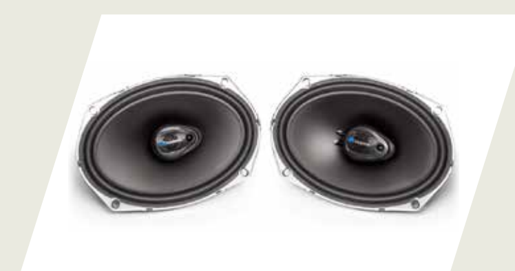
KIT PARLANTES DELANTEROS