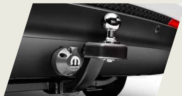
GANCHO DE REMOLQUE