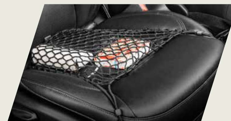
RED ELÁSTICA DE ASIENTO DELANTERO