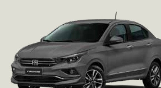
979 - Gris Silverstone