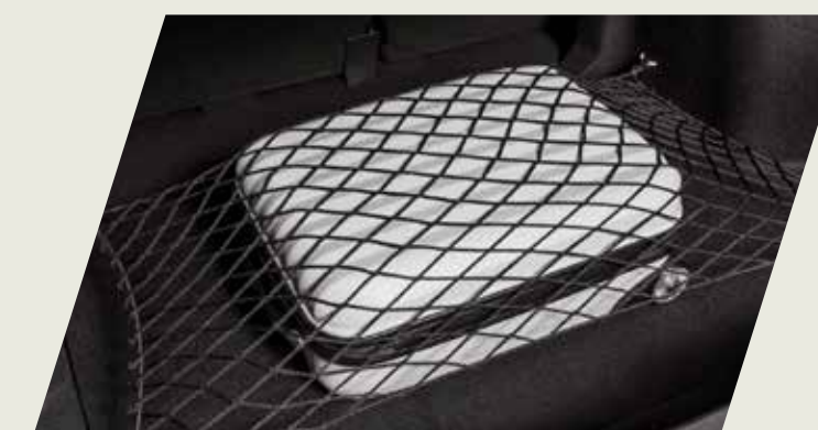
RED ELÁSTICA PARA BAUL