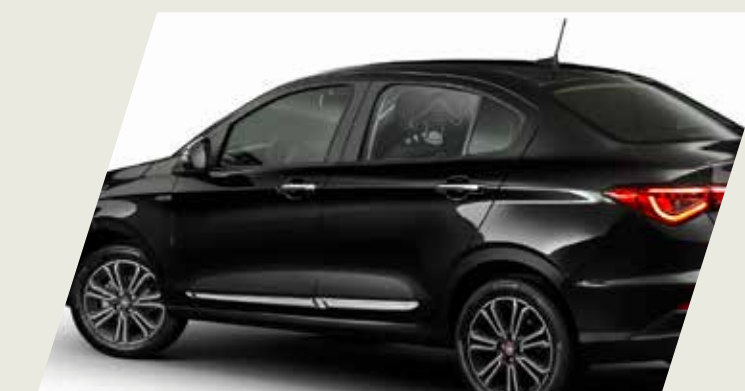
MOLDURA DE PUERTA CROMADA