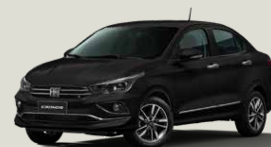
806 - Negro Vulcano