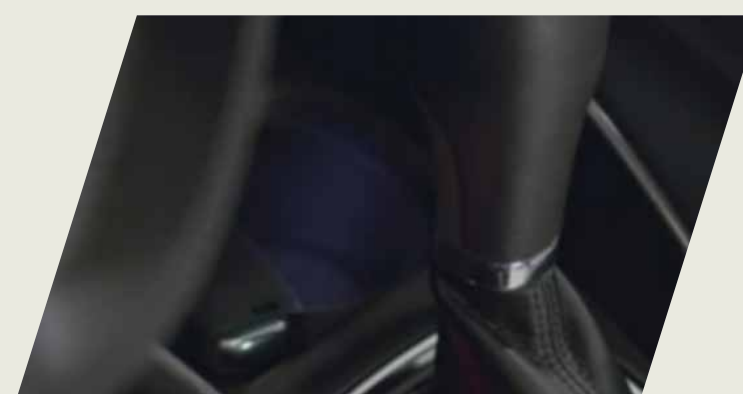
KIT ILUMINACION INTERIOR